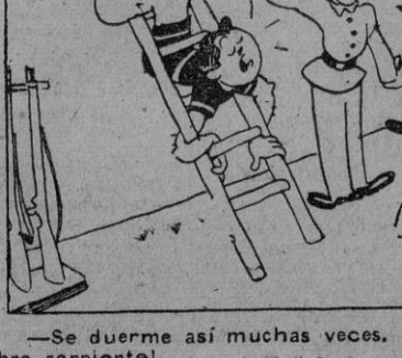
Se duerme así muchas veces. ¡Antes de movilizarlo trabajaba de hombre serpiente!

La batalla de Singapur alcanzó anoche su punto culminante, informan los medios de comunicación.