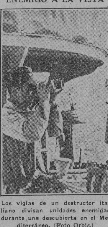
Los vigías de un destructor italiano divisan unidades enemigas durante una descubierta en el Mediterráneo.