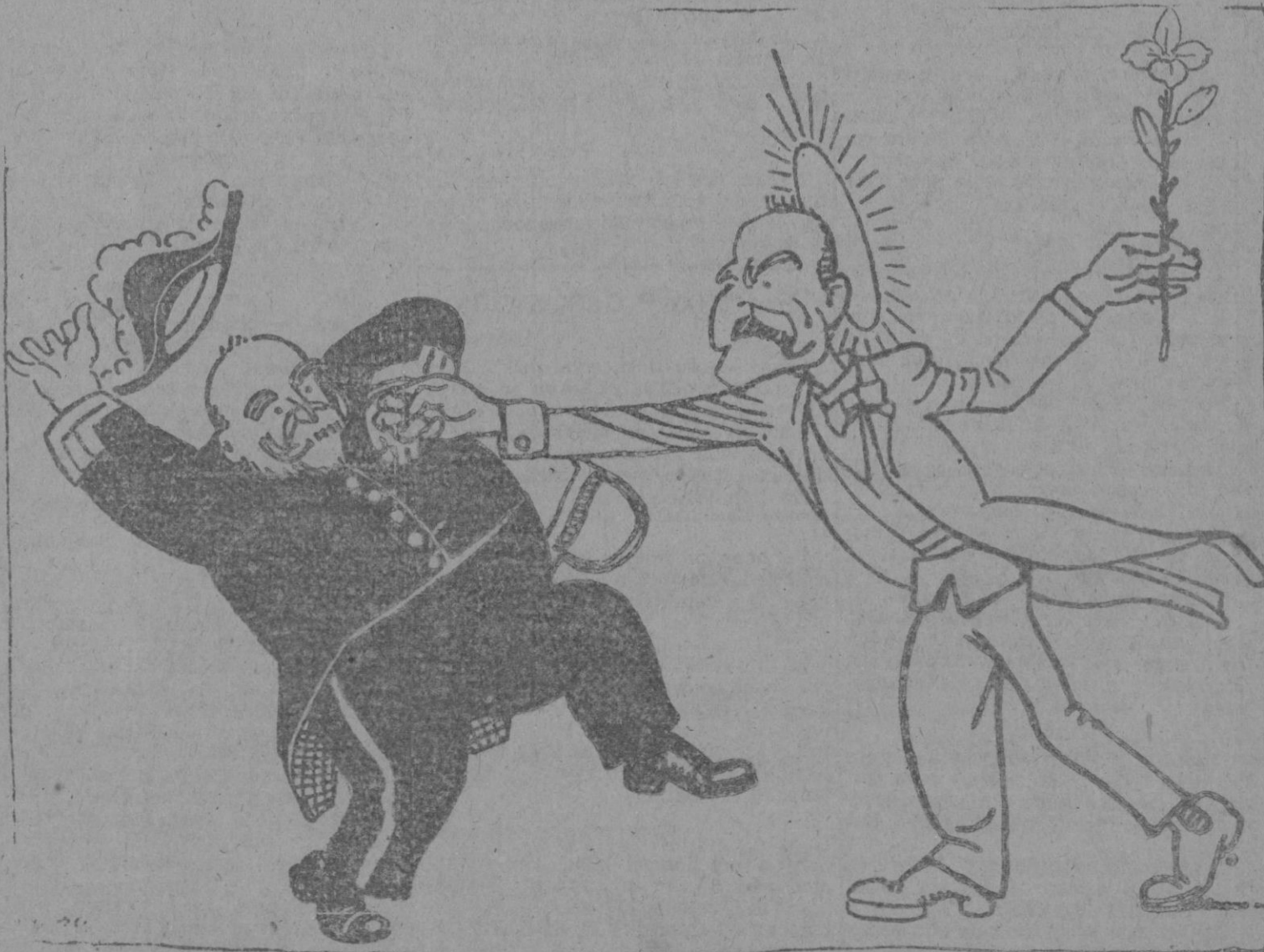
ROMANONES BRINDANDO LA «PAZ Y ALIANZA» AL NUEVO MINISTERIO