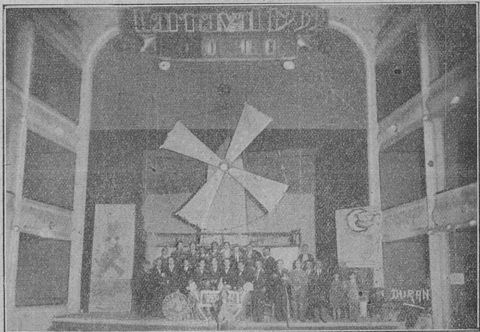
Molino luminoso giratorio que figuró en el adorno del Teatro Principal con motivo de los bailes de Carnaval organizados por la Sociedad «Juventud Republicana» de esta ciudad.