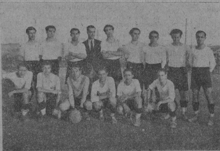
El campeón de Menorca y finalista del campeonato de Baleares, vencido ayer en Son Canals por el campeón de Mallorca