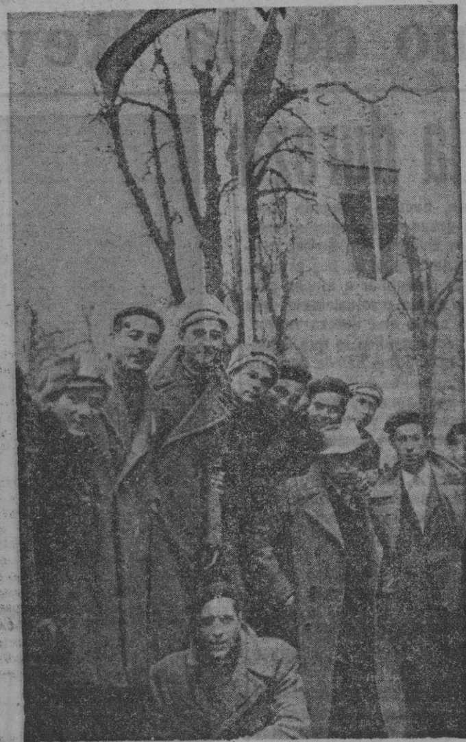
Trabajadores españoles a su llegada a tierras alemanas

En conjunto, el escrito, que zuma encantadora ingenuidad, un elevado exponente del entusiasmo de nuestros productores en Alemania y constituye una mentis a las falaces afirmaciones de sospechosos elementos extranjeros, que el muchacho aludido condena en su carta con enérgicas y duras frases.