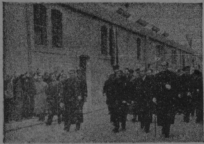
S. E. el Jefe del Estado, Generalísimo Franco, durante su visita a las fábricas de tejidos de Tarrasa

El presupuesto de contrata asciende a dos millones setecientos noventa y siete mil doscientas cuarenta y nueve pesetas con dos céntimos (2.797.249'12).