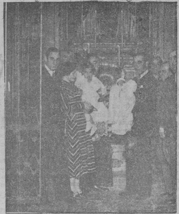
En la iglesia de San Vicente Ferrer, de Valencia, se ha celebrado, con gran concurrencia de público, el bautizo de una hija del popular espada Vicente Barrera

caer sobre un periodista: encontrar una fuente directa de información que, en un momento tan trascendental como el que atraviesa la política exterior española, pueda servir para orientar claramente a la opinión.