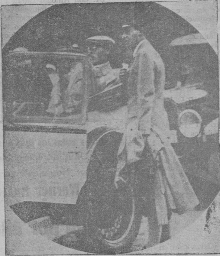
El Príncipe Umberto, nieto del ex-Kaiser, que estuvo en Palma el domingo