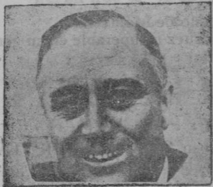
Mr. Roosevelt, que acaba de ser elegido, por gran mayoría sobre su contrincante Mr. Hoover