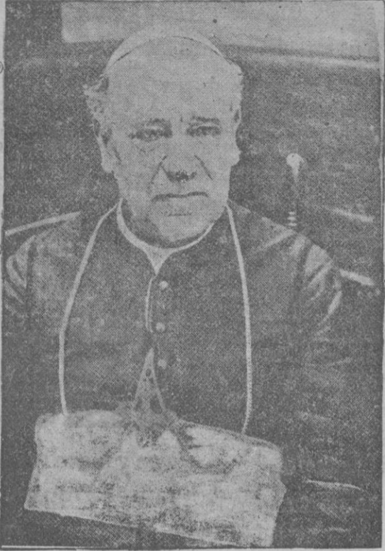
El Arzobispo Mn. Ruiz Flores, que el gobierno mejicano, rompiendo sus relaciones con el Vaticano ha obligado a abandonar el país