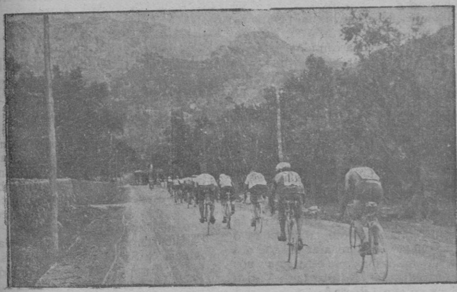
La bajada del «Coll» de Sóller