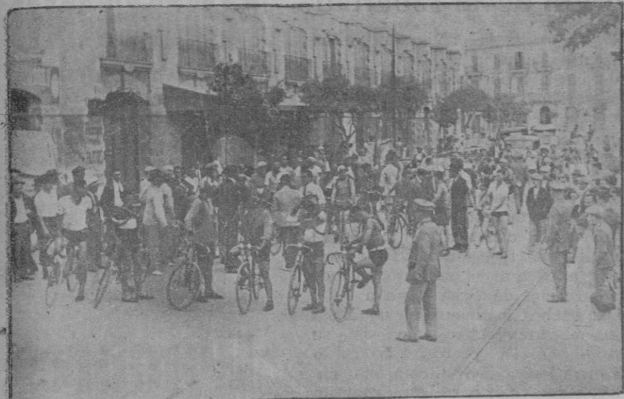
Los corredores preparándose para la salida