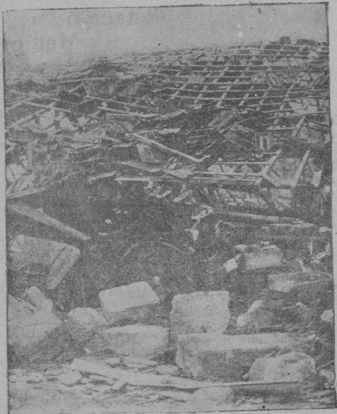
Restos de un garage, hundido a consecuencia del ciclón que azotó la ciudad de Pontevedra

Victor Hugo; el genial y fecundo novelista francés, en uno de sus frecuentes viajes por España, llenos de sabia inteligencia; en las que iba asimilando el espíritu depurado de nuestra raza, bautizó a Valencia—la ciudad de los frutos de oro—con el nombre de «la ciudad de las cien torres». Esbeltas y graciosas torres, que adornaban las perspectivas azuladas del panorama, que se divisaba, en el horizonte puro, lleno de magníficas luces, que como enorme catarata de colores, iba volcándose, sobre la campiña esmeralda, contorneada de flores. La nueva piqueta renovadora, con su afán constante de destruir lo viejo—como si no fuera digno de recuerdo—y de la rosa del más puro recuerdo—ha ido ensañándose con las moles características de la altura, destruyéndolas poco a poco, y dejando solamente las genuinas, que pueden representar como un símbolo a la Valencia de todos los tiempos, perfumada con las auroras del Mediterráneo.