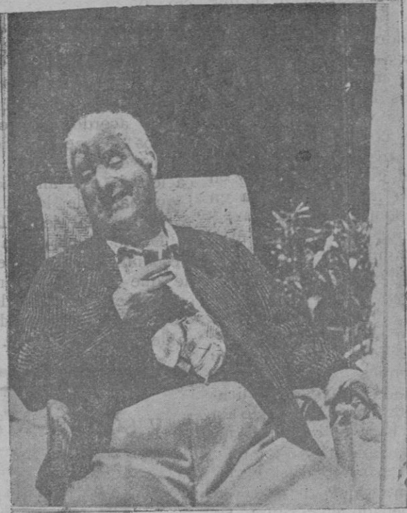
El notable actor Enrique Lacasa, que ha fallecido repentinamente en Córdoba, donde se hallaba interpretando el argumento de la película sonora «Carceleras»

Nudos de amor, estrechos, ciegos, [crudos, nudos de amor doy firmes y ayuda. [dos.. Ve presto mi conjuro y la mar pasa, y vuelve de la orilla a Dafni, a casa! Así como esta cera torna blanda así como este barro se endurece y un mismo fuego en ambas cosas [anda