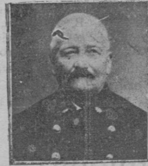
El Patrón de la Tabacalera que fue rapado por el laud «San José»