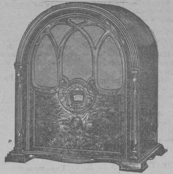
ONDA CORTA y LARGA

Un solo mando directamente a la corriente alterna Control de tono gran selectividad Demostraciones a solicitud