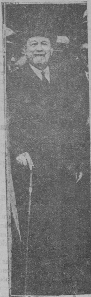
Fallecido en Paris.— Fue jefe del partido conservador y minis- tro en el último Go- bierno de la monar- quía

cuerdos entre las paredes de la «casa de los poetas» donde te habrán aplau- dido las Musas de Alcover.