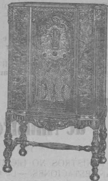
ONDA CORTA y LARGA