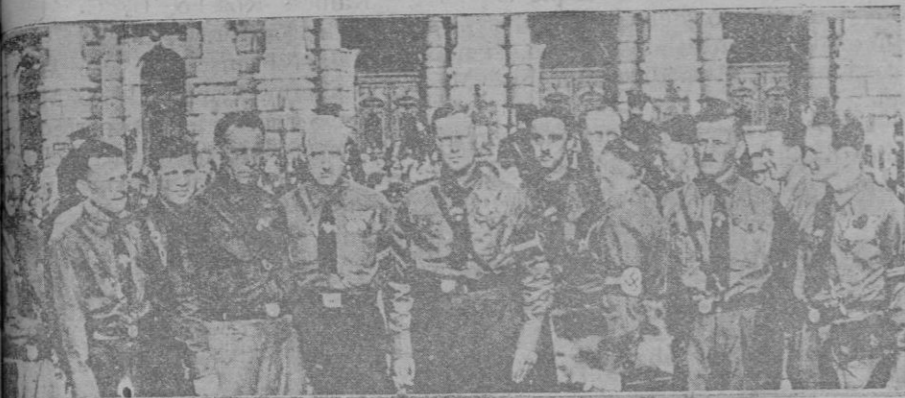
Los nuevos concejales hitleristas de Viena, que ostentan sobre sus camisas las insignias del partido