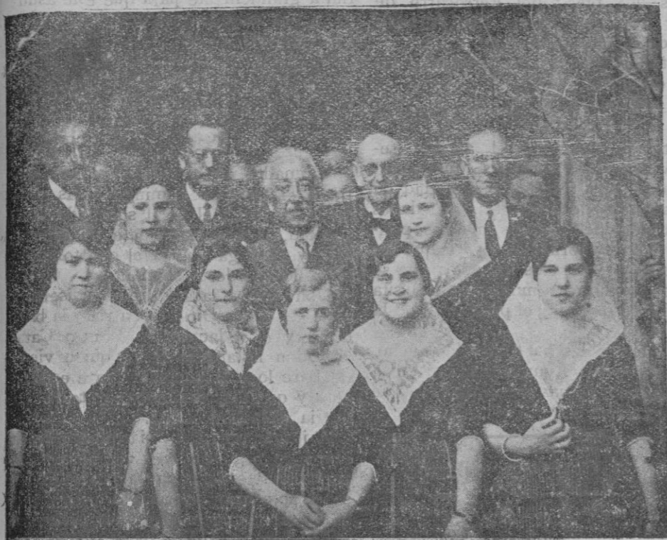
El Presidente saliendo de la Casa Consistorial rodeado de payesitas mallorquinas