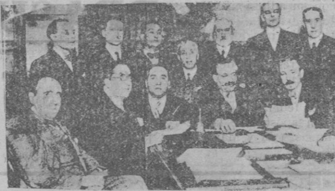
Los miembros de la Comisión parlamentaria que entiende en los suplicatorios contra los señores March y Calvo Sotelo

za, sino como agrupación o confederación con tendencias afines.