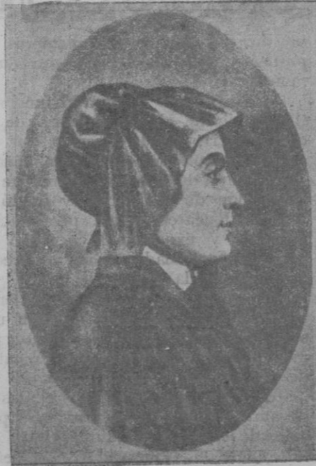
Nueva York.—La Rda. Madre Elizabeth Seton, fundadora de la Congregación de las Hermanas de la Caridad en los Estados Unidos, y cuya canonización ha sido pedida a Su Santidad.

voluntad y la personalidad, la representación gráfica de nuestro estímulo. Para nosotros cualquier tiempo pasado fué peor; cualquier tiempo futuro habrá de ser mejor.