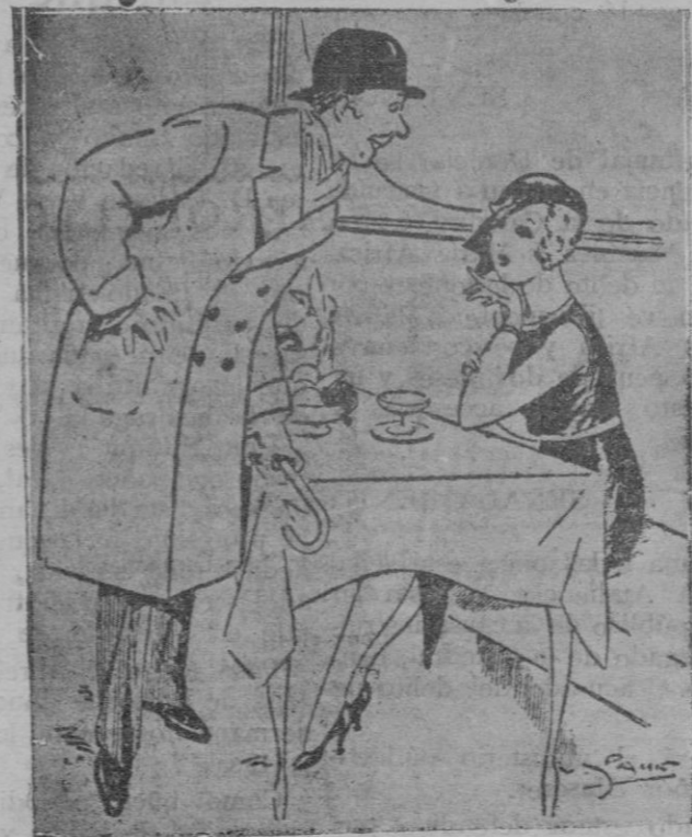
El.—Lo cierto es que la estupidez es hereditaria. Ella.—Eso es, métete ahora con tus padres. (De «Ruy Blas», de París)