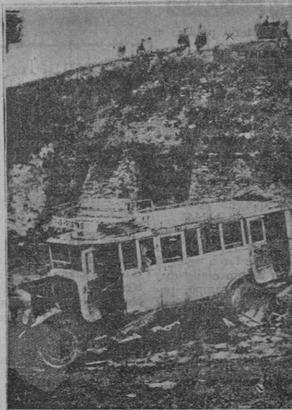
Estado en que quedó el automóvil al caer desde una altura de quince metros que ocasionó la muerte de quince viajeros y heridas graves a treinta más