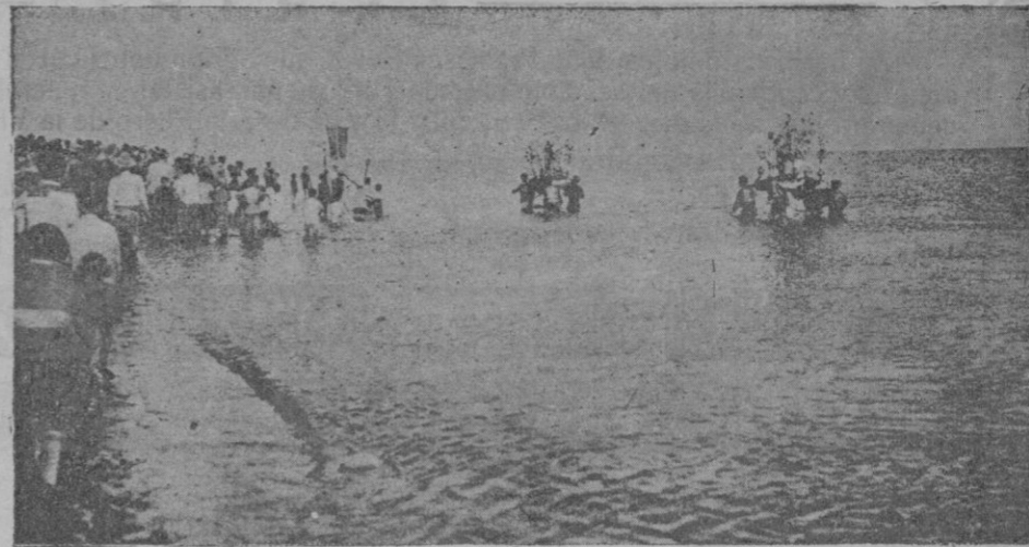
La tradicional procesión marítima de las imágenes de San José y Nuestra Señora del Carmen, patronos de los marineros de isla Cristina (Huelva), que se celebra anualmente