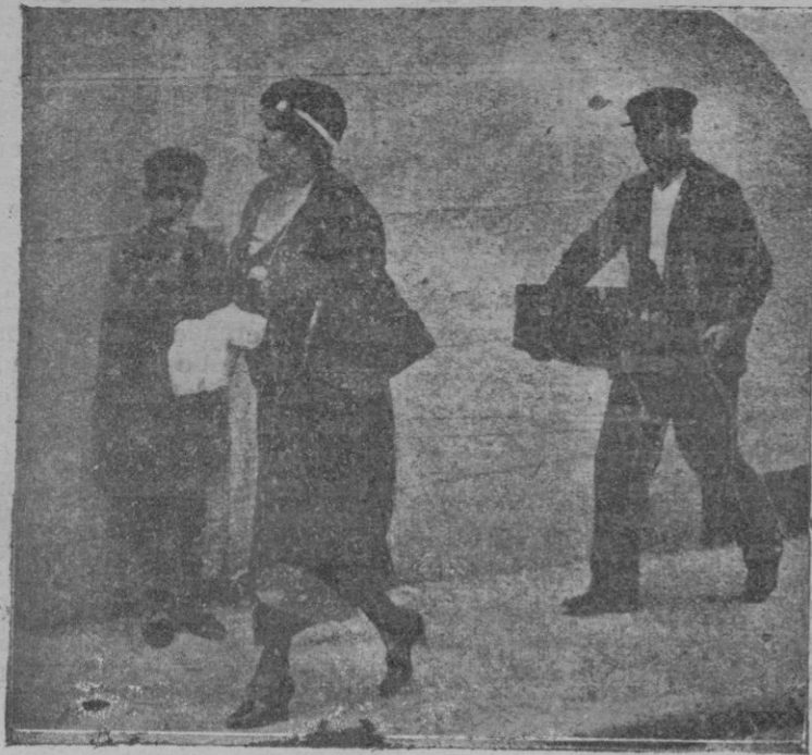
La esposa del general Cavalcanti, entrando en Prisiones Militares para visitar a su esposo. Detrás, un criado lleva la maleta del general