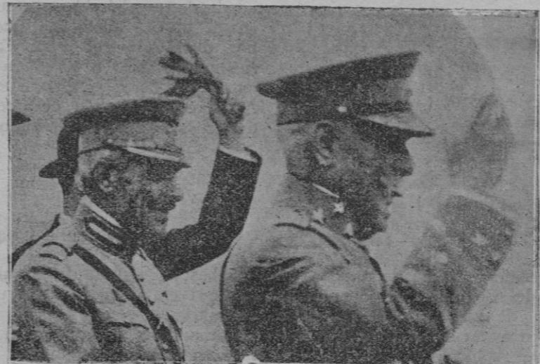
El general Carmona, jefe del Gobierno, saludando a las tropas, en una revista militar

a examinar el valor histórico del documento y asegura que tanto bajo el concepto paleográfico como en el moral, es de indiscutible trascendencia en favor de la tesis de que Cristóbal Colón es español y además mallorquín.