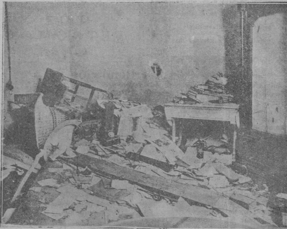
Estado en que quedó la habitación, después del atentado