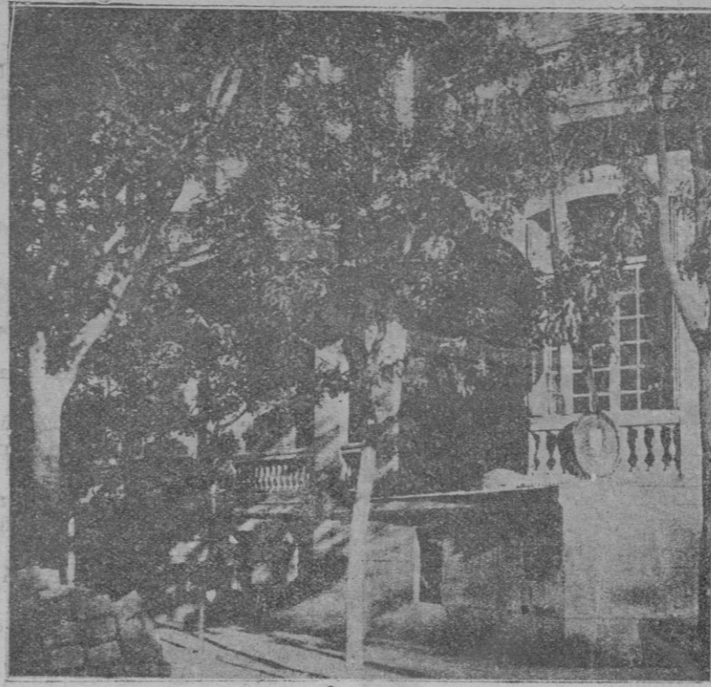
Vista del edificio de la Embajada de Portugal. Por una de sus ventanas, que están a la altura de un hombre fué arrojada la bomba