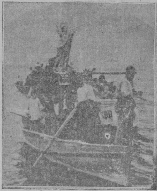
La procesión marítima de la Virgen de Agosto, Patrona de Los Alcázares (Murcia), recorriendo la bahía de la Mar Menor