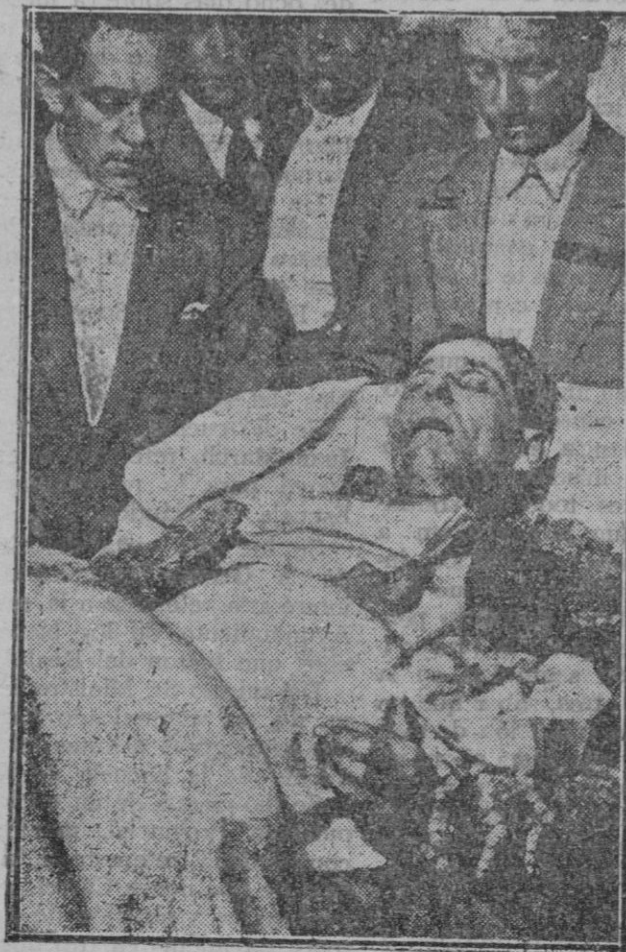
El infortunado diestro en la enfermería de la Plaza de Madrid, donde falleció a los 45 minutos de haber recibido la comada. Tenía el infortunado diestro 38 años de edad, y había torreado este año dos corridas