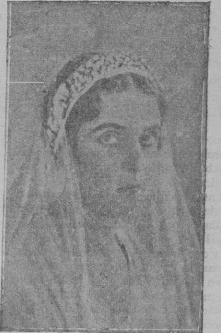
La princesa Teodora de Grecia, contrajo matrimonio en Baden-Baden con el margrave de Bade

ya no son mis enemigos, ya no son mis adversarios. Y un hombre así es viene a decir que lo primero que necesitamos para enjuiciar bien este problema es levantar el espíritu de la tolerancia y después pensar que no hay alma que no sienta a su manera una emoción religiosa, y lo que necesitamos es tolerancia y espiritualidad para enfocar bien este asunto.