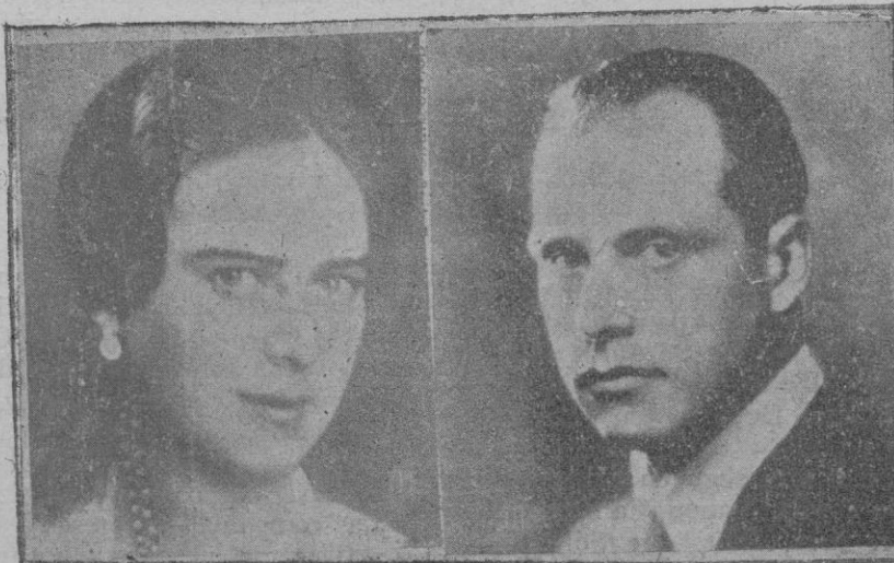
La Princesa Ileana de Rumania y el Archiduque Antón de Habsburgo, que acaban de contraer matrimonio

cap los periodistas y él no rehuye el diálogo. Contesta a todo. ¡Qué feliz camina para arriba y para abajo por los pasillos!