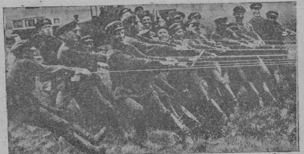
Leningrado.—Tropas soviéticas trabajando para efectuar el amarre del dirigible