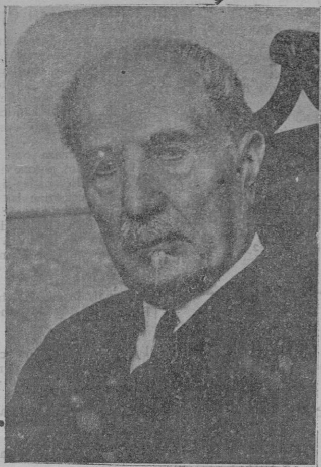
El diputado de más edad D. Narciso Vázquez Lemos, que por dicha circunstancia presidió la primera sesión de las Cortes Constituyentes