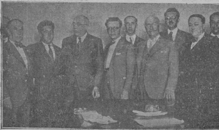
El Comité Nacional de Alianza Republicana con los ministros señores Lerroux, Azaña y Martínez Barrios que abarcando tres grupos forma la minoría más numerosa de las Constituyentes