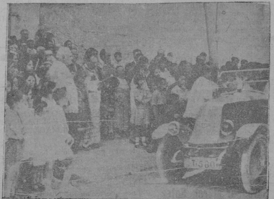
En Valencia, el día de San Cristóbal, como en Barcelona, hubo bendición de automóviles, fiesta que este año no se ha celebrado en Palma