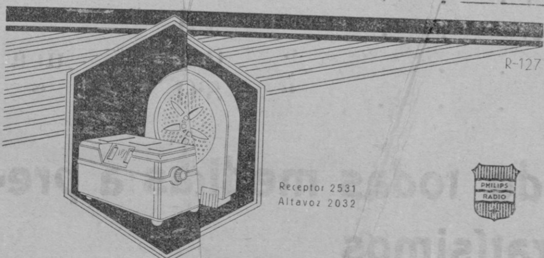
Receptor 2531 Altavoz 2032

Avenida Alejandro Rosselló, 103—Teléfono, 357