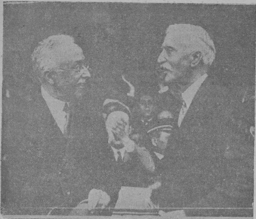
El Presidente del Gobierno de la República Española Sr. Alcalá Zamora y el Presidente de la Generalidad Catalana Sr. Maciá, el domingo en Barcelona al ser ovacionados por el público