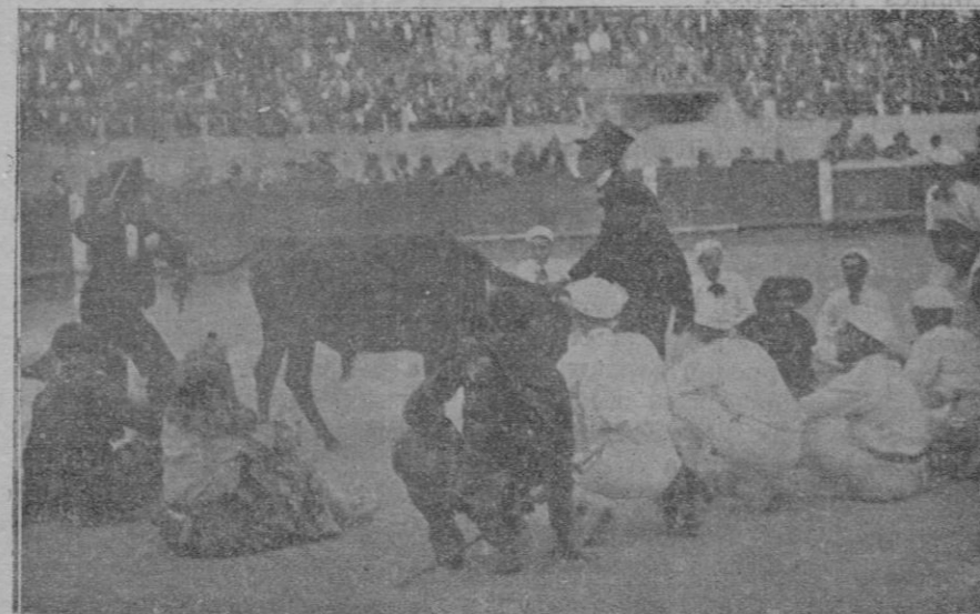
Banda charanguista taurina «La Tempestad» que el domingo pasado actuó con lisonjero éxito en el festival organizado por el café Ca'n Nam, Inca