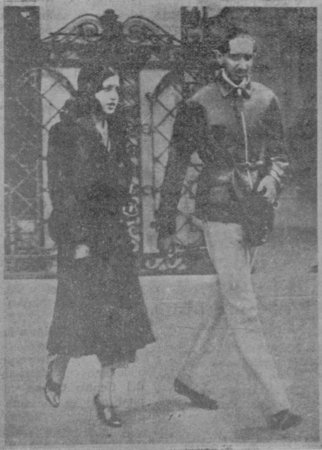
El Maharaja de Ineo, con su bella esposa, que ayer llegaron a Palma, para pasar una temporada en Formentor