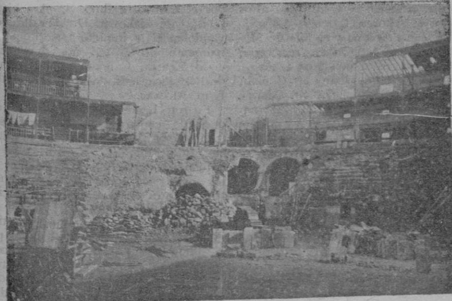
En plena demolición.

Mucho antes de existir la plaza actualmente en demolición existía otra, de madera, situada en el foso de la muralla, en el lugar conocido por «Ses Rafas». Más tarde se construyó otra, de piedra, con palcos o balconillos de madera, en el mismo lugar de la que se está derribando, plaza pequeña e incómoda, que los antiguos llamaban «Tencats», y en la que se desarrollaban las riñas de perros, riñas de pe-