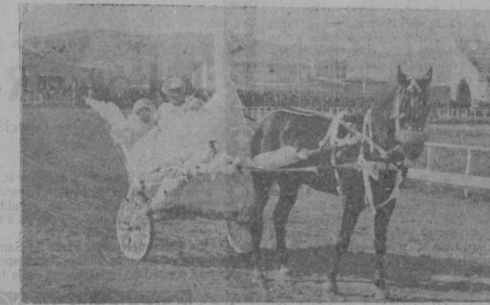
Tiro de los sementales y caballos adornados que figuraron en la cabalgata.

No hace mucho, en un teatro de una gran ciudad europea, se intentó, con relativo éxito, medir y contrar la receptividad emocional de varias mujeres, unas rubias, otras morenas, frente a un «film» amoroso de gran fuerza sentimental y dramática. Al terminar el experimento, las morenas ha-