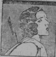
quita esos dolores

Roma, 7.—Se hicieron sentir fuertes sacudidas sísmicas en Melfi.