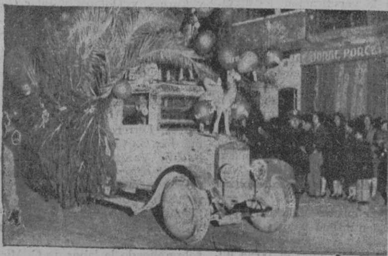
Uno de los camiones, que, cargados de juguetes para repartir a los pequeños, seguían a la cabalgata.