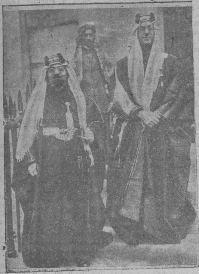
El embajador del Hejar y de Nejd (Arabia) al salir de su mansión para dirigirse al Palacio donde fue recibido por S. M. el Rey de Inglaterra