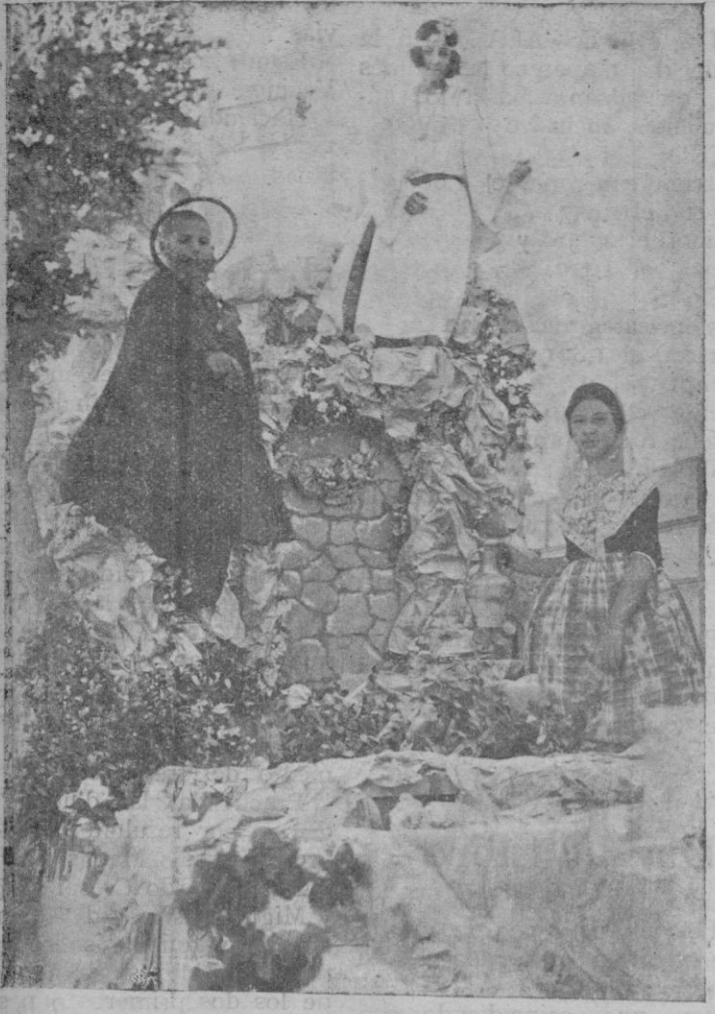
«Aparición de S. Antonio Aban junto a la fuente», carroza de la Congregación Mariana

Los heridos eran trasladados a los hospitales, que naturalmente eran insuficientes, mucho más habiendo sufrido también los efectos del ciclón.