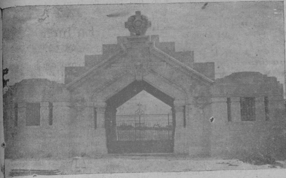
La artística portalada del nuevo cementerio