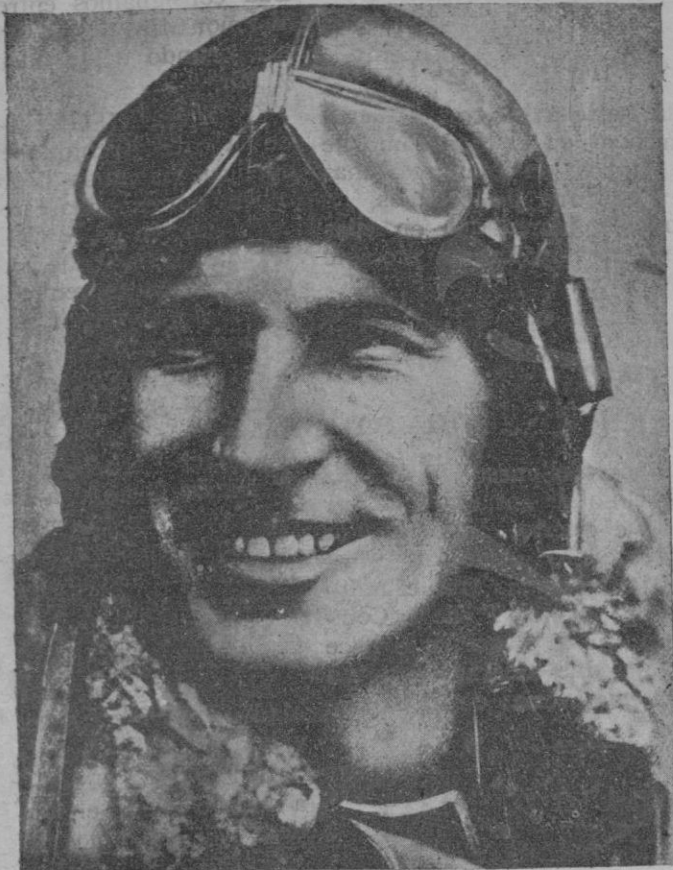
El mayor Kingsford Smith, aviador australiano que pilotando el «Cruz del Sur», ha realizado la travesía aérea del Atlántico de Este a Oeste, o sea la travesía difícil, solo realizada por el «Bremen»