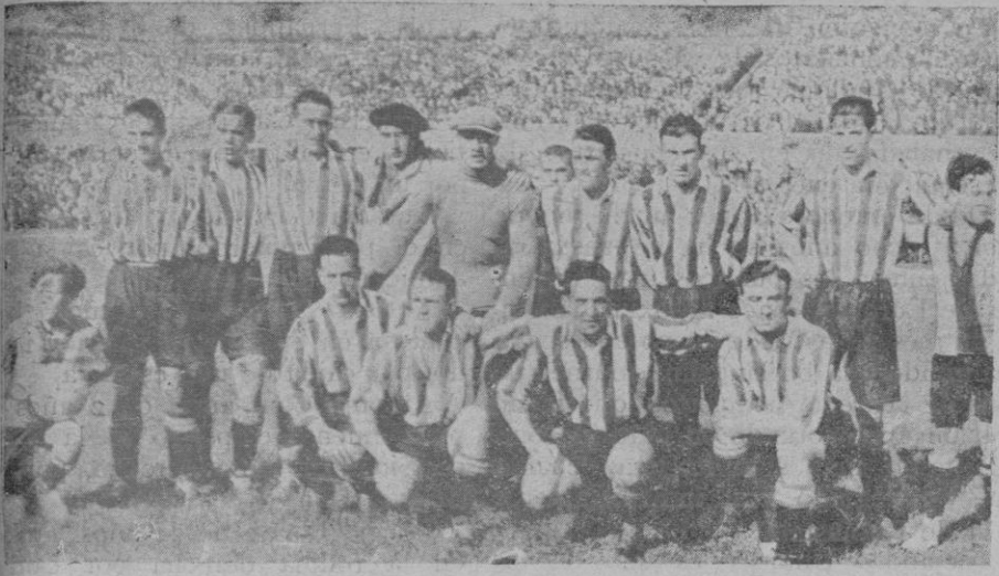
El «team» del Athletic de Bilbao, que venció al Real Madrid, el domingo en Barcelona