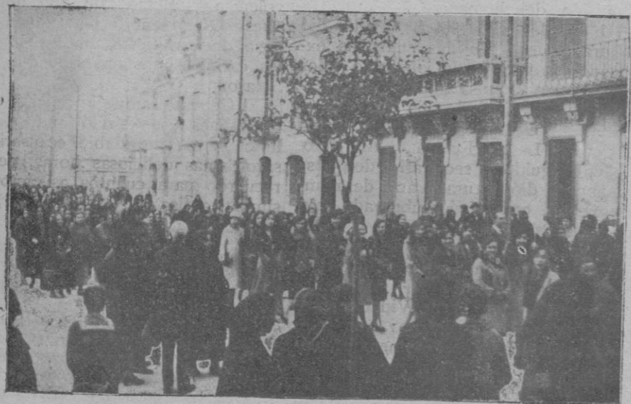
Dos momentos de la procesión organizada por los PP. Capuchinos