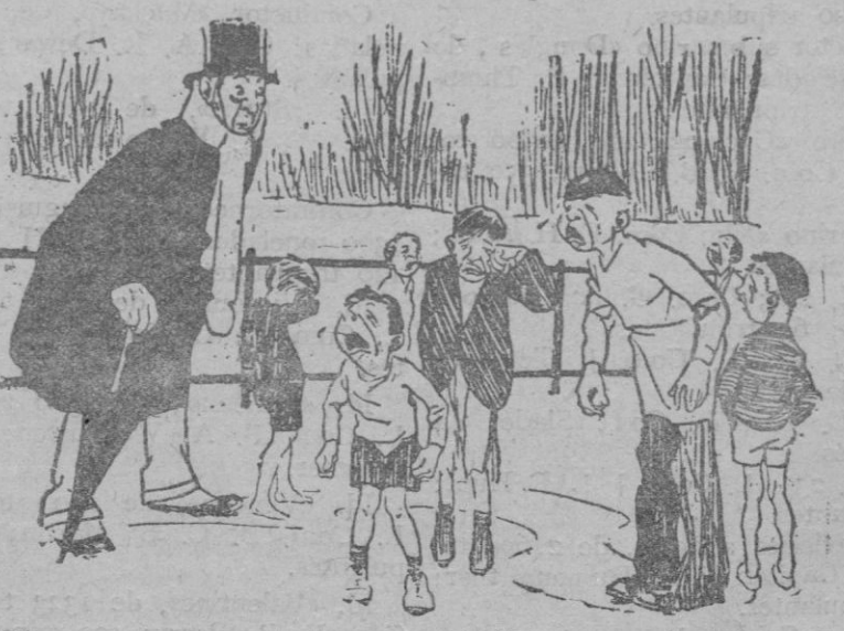
Cómo reciben al caballero que, el día anterior, le dió una perra a uno que estaba llorando.