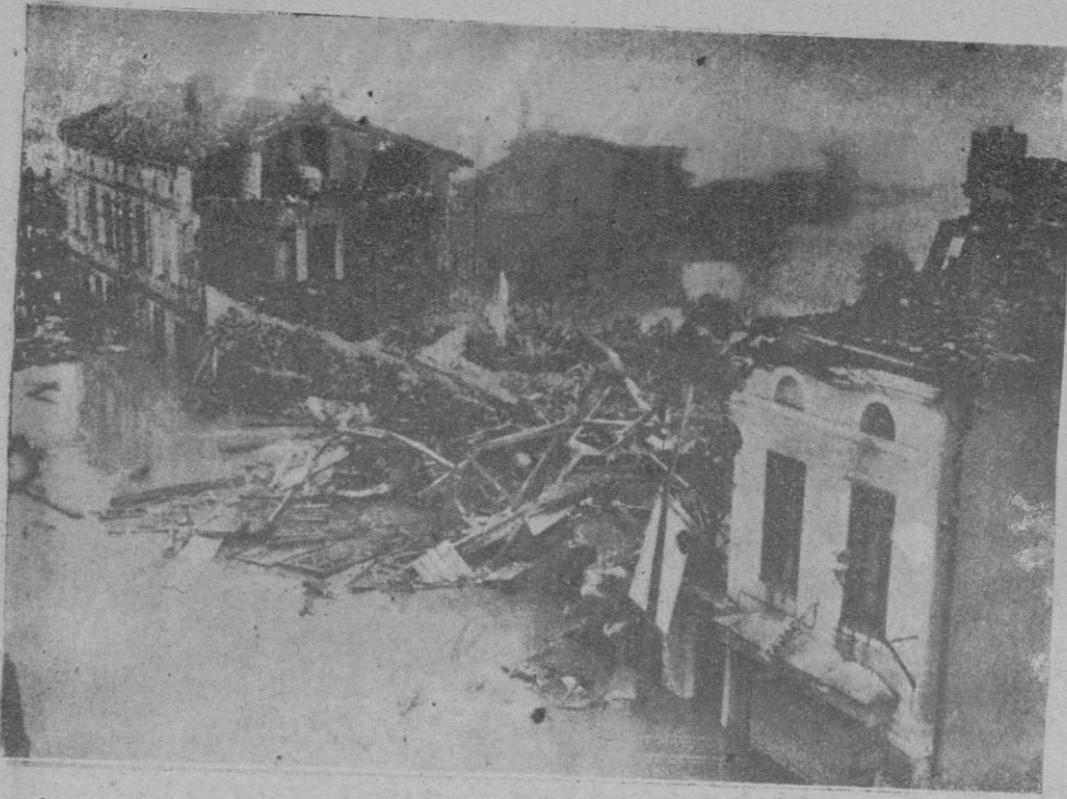
Estado en que ha quedado uno de los pueblos afectados por la inundación