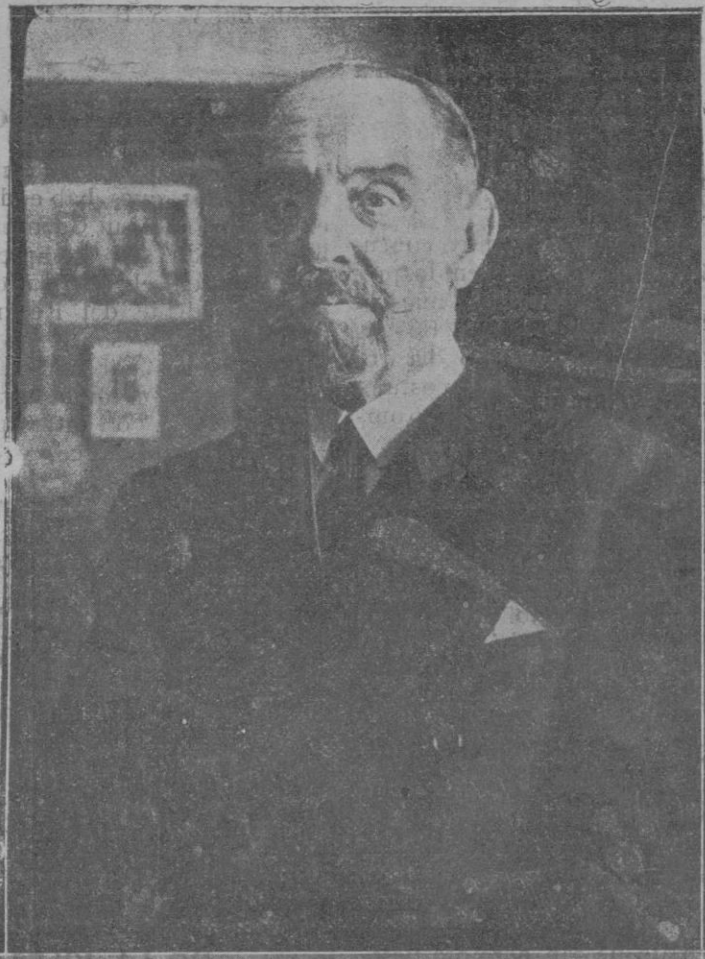
Nuevo Gobernador civil de Barcelona