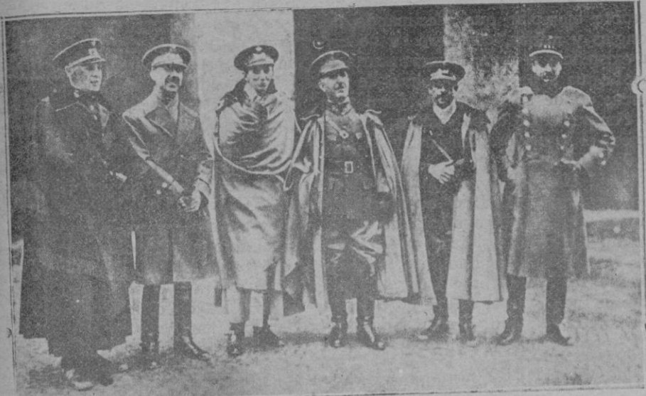
Jefes y oficiales que forman el equipo español, y que tan brillantemente han actuado en Berlín