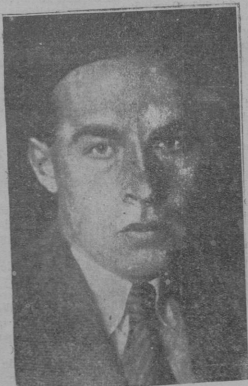
El novelista alemán Erich María Remarque, autor del libro «Sin novedad en el frente» que ha causado tanta sensación en el mundo entero, que está entre la vida y la muerte a causa de un accidente automovilista.