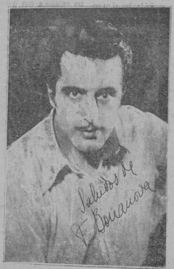
Nuestro paisano Sr. Moll, (Fortunio Bonanova), que ha triunfado en la pantalla

neras artificiales, pero elegantes, del varón mundano que siembra la agitación en los corazones femeninos. Hablé antes del histrionismo y me refería al gesto a laido del tipo que no se puede concebir sino en lances de amor, ora fustigado en críes arrebatos de pasión a la mujer suave y armónica que se le rinde, ya arrastrándose a los pies de la mujer pendenciera que sabe matar a hierro y morir a hierro si viene al caso.