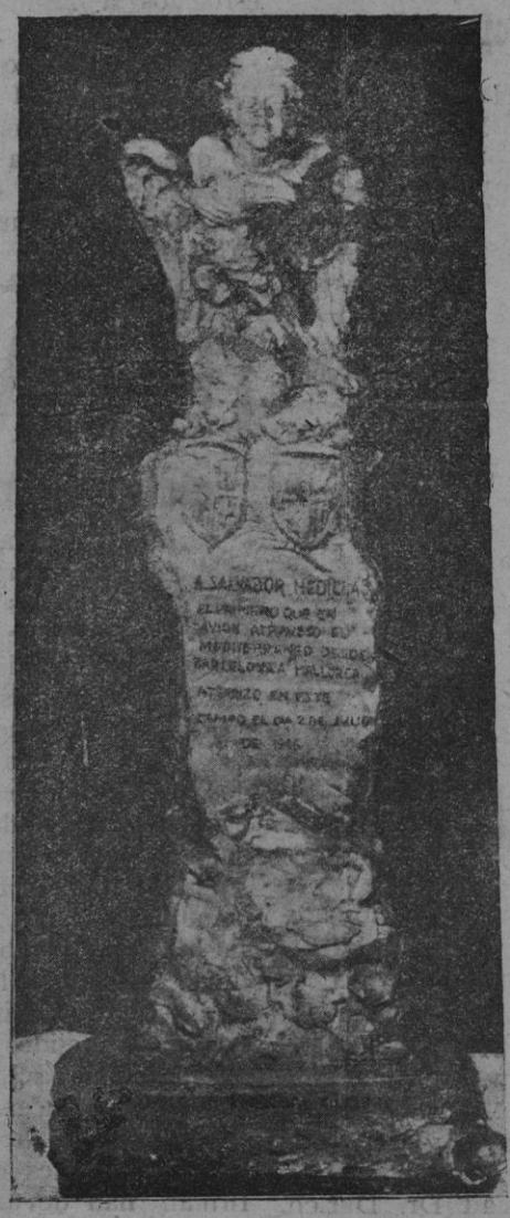
El proyecto de monumento al aviador Hedilla, original del escultor don Pascual T. Jofre, que ha sido elegido en el concurso celebrado