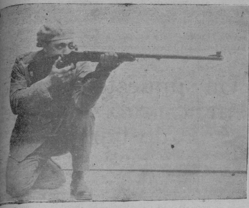
El paisano, que ganó el campeonato mundial, de tiro de rodillas en Stokolmo