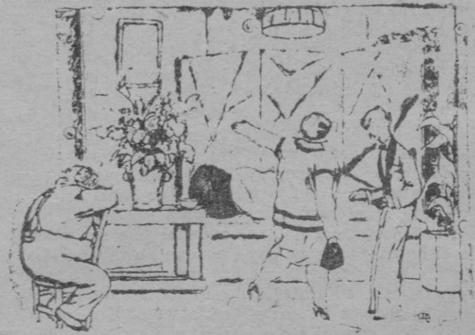
EL «CINE» SONORO

El Director.—¡Más fuerte! ¡Qué se oigan bien las dos bofetadas!