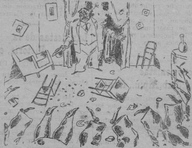
—Para que vean ustedes que soy hombre de palabra, vengo, a pesar de que tengo la viruela. (De «Paris Mid»)»