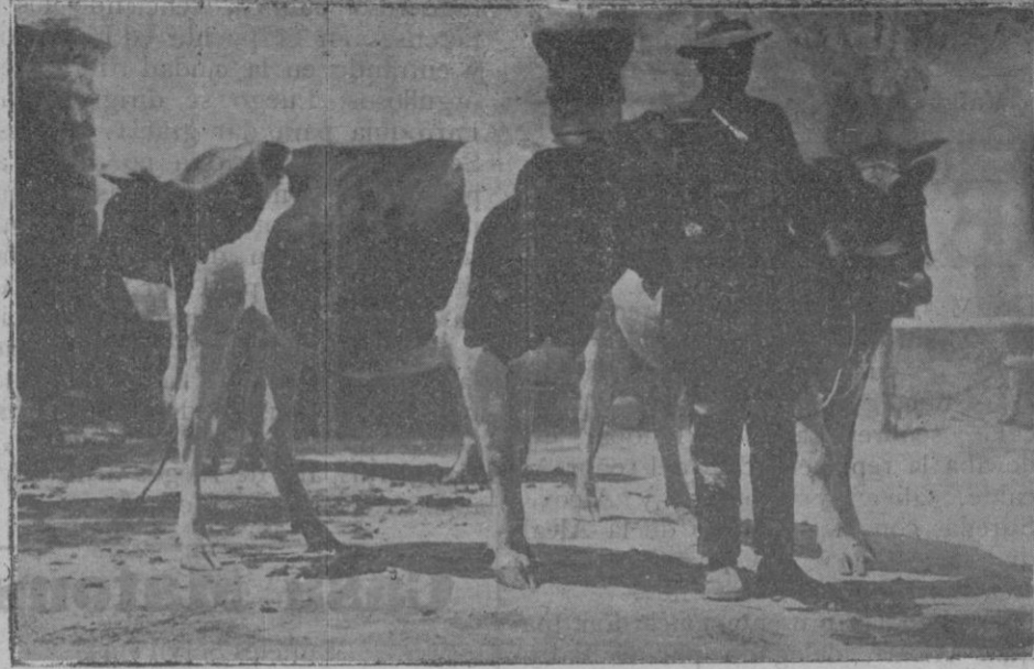
Temeras holandesas, premiadas, propiedad del Conde de Peralada