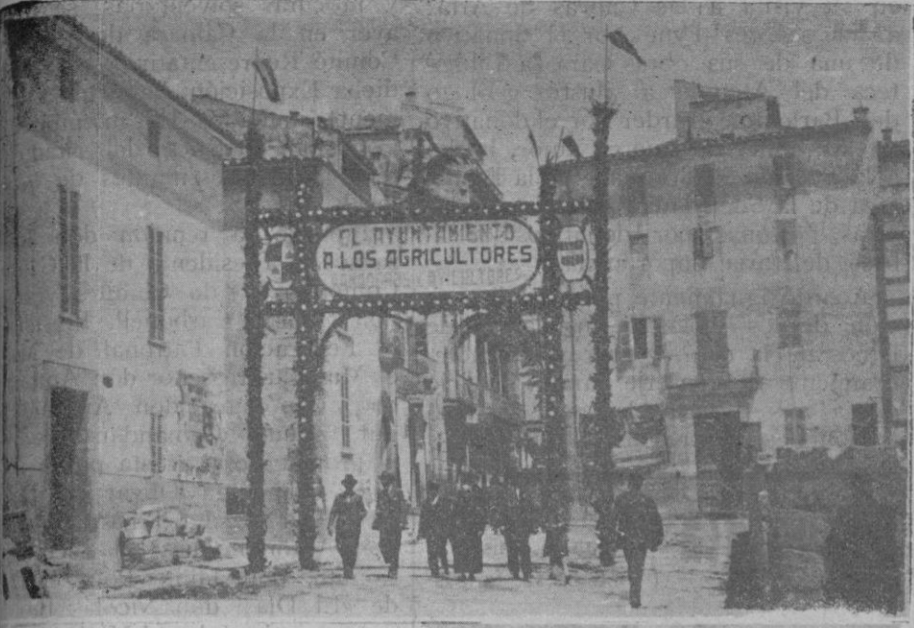
Arco de triunfo levantado por el Ayuntamiento de Inca en honor de los congresistas