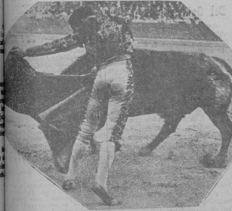
Melechor Delmonte, en la plaza de Zaragoza