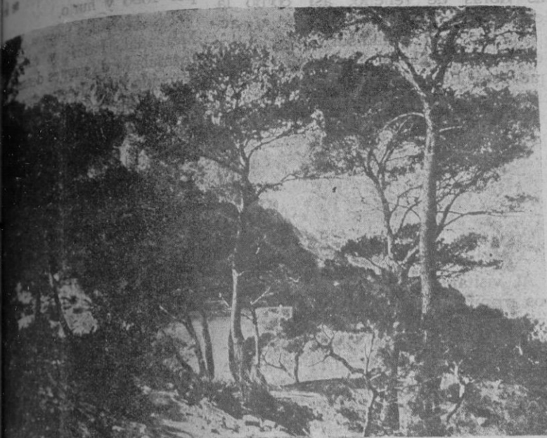
Vista de las sugestivas «caletas» del Mal Pas (Alcudia)