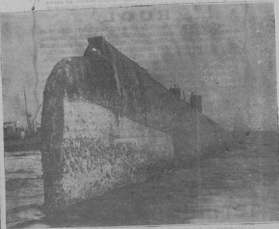
El casco del arorazado alemán «Kaiser», puesto a flote, quilla arriba, que fué hundido después del famoso combate de Scapa Flow