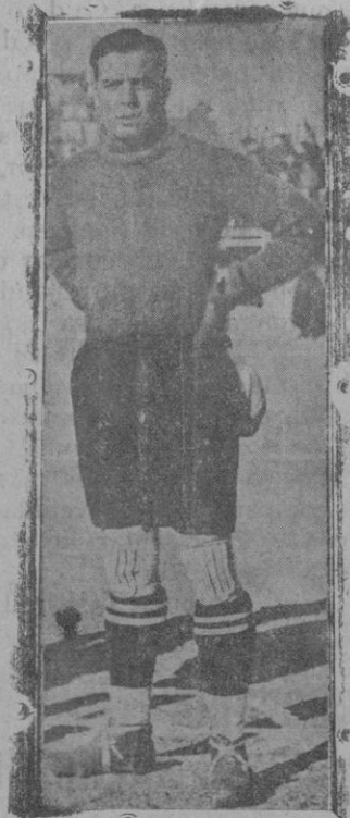
El famoso guardameta del equipo nacional, que capitaneando al C. D. Español, luchará mañana y el lunes contra el Alfonso XIII

poco respetuoso—¡la juventud!—para con los consagrados y las figuras eternas ha hecho una adaptación de «Hamlet». Más que una «adaptación libérrima» como él la califica, lo hecho es una obra nueva tomando escenas, personajes y frases de la obra de Shakespeare; pero sin que de esta queden algunas escenas importantes entre las que sobresale la última en la que en lugar de morir, triunfa Hamlet en toda la línea y es proclamado rey de Dinamarca.