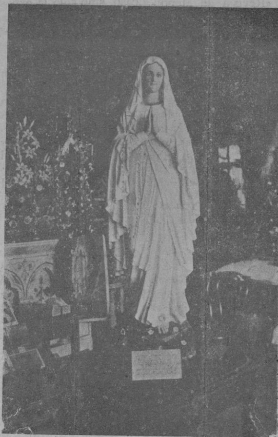
Imagen de la Virgen de Lourdes, adquirida en Lourdes por el peregrino D. Vicente Pol, para ser colocada en la Iglesia Parroquial de La Puebla de donde es natural el donante