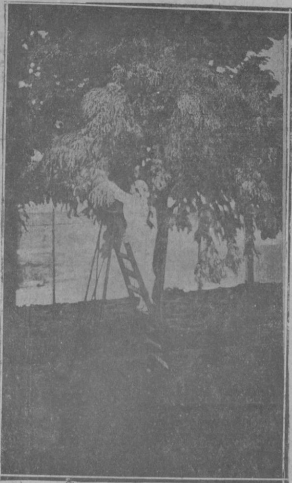
«Aromo en flor»

menaje organizado por la So- «La Veda» a la memoria del pintor uruguayo Pedro Blá- me parece un acierto y de todo elogio.