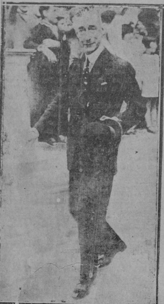
El duque de los Abruzzos, hijo del Rey Ama- deus, que acaba de visitar España