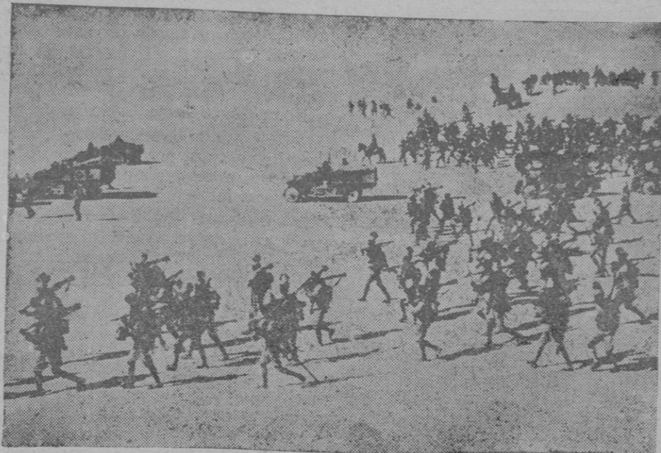
Las tropas de penetración, avanzando sobre el desierto