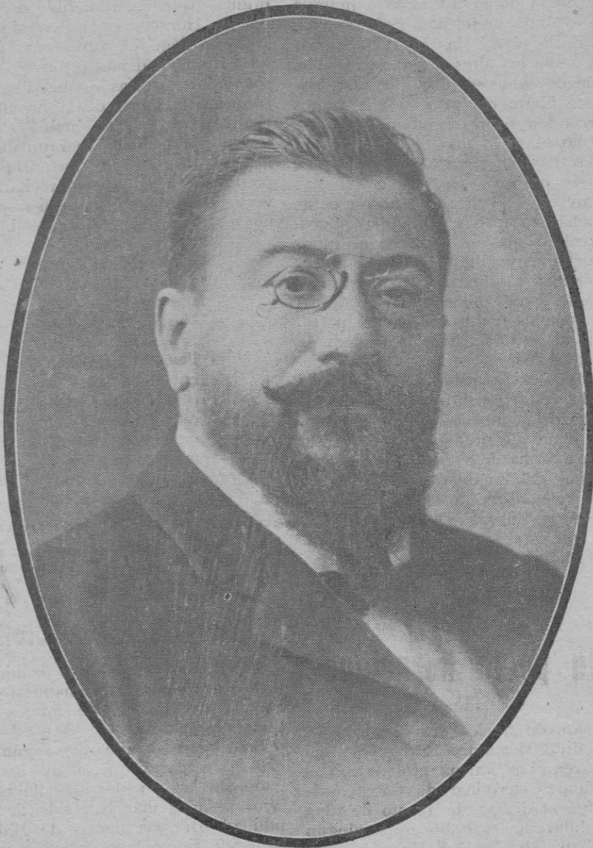
† Sr. Vazquez de Mella